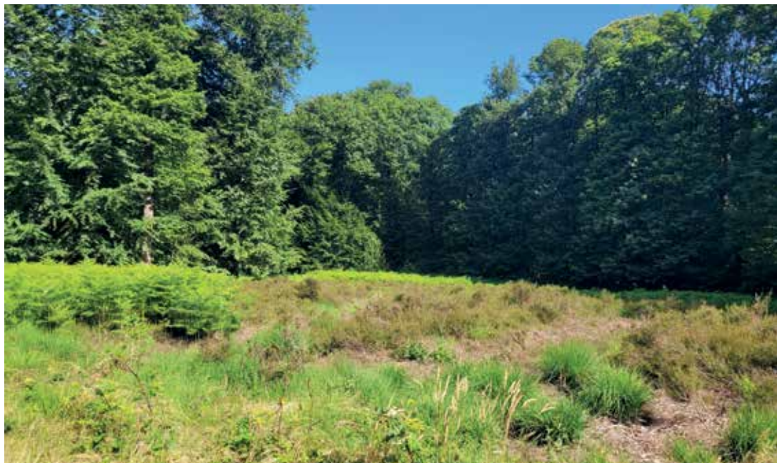
Heideveld in de speelzone