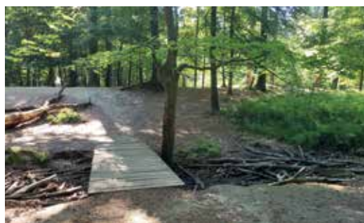
Ingang van de speelzone met beek en brug