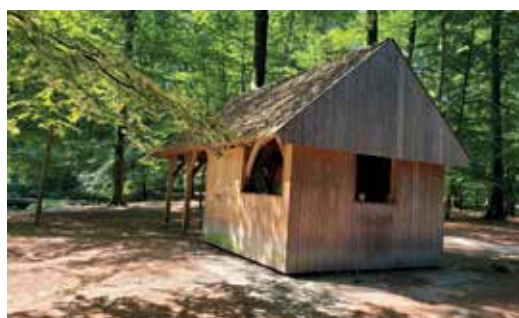
Hut aan de speelzone