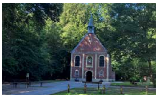
De authentieke boskapel