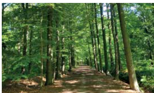
Brede dreven met oude eikenbomen