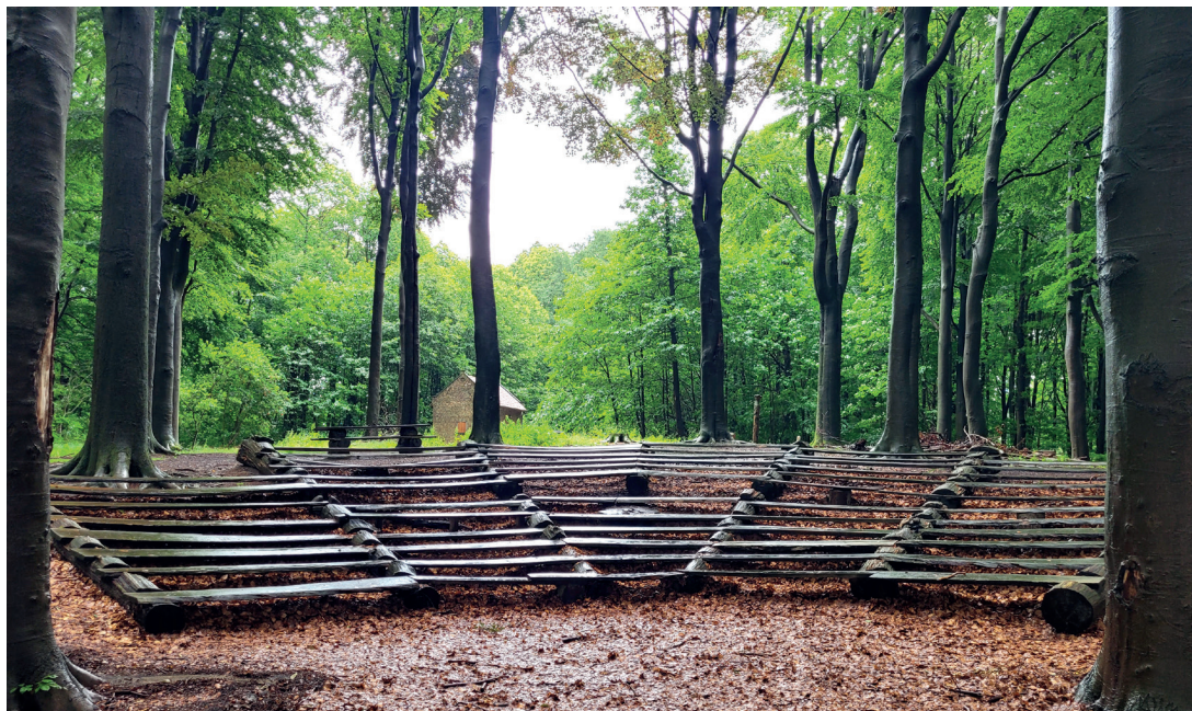
Amfitheater geschikt voor optredens tot 200 personen (vooraanzicht)