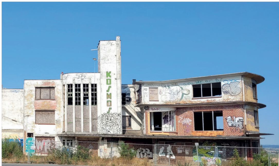
De Kosmos, beschermd monument