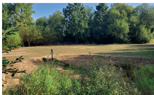
Open speelzone naast het amfitheater