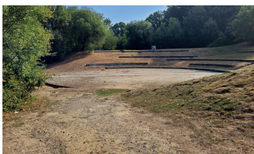
Het amfitheater onderaan