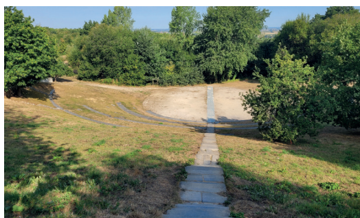
Het amfitheater aan de voet van de Kosmos