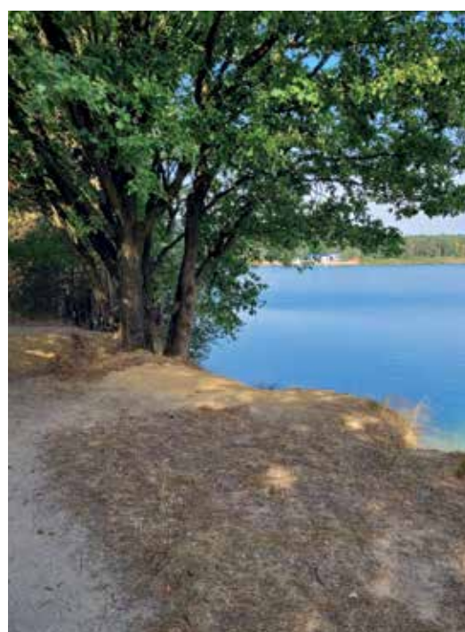
Paadjes langs het water