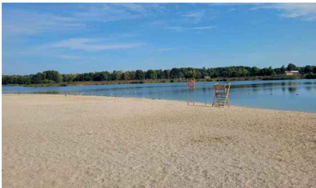
Zwemzone aan de Plas