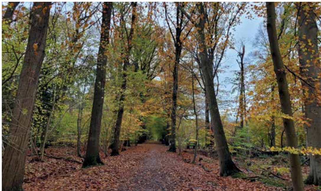
Brede dreven met statige bomen