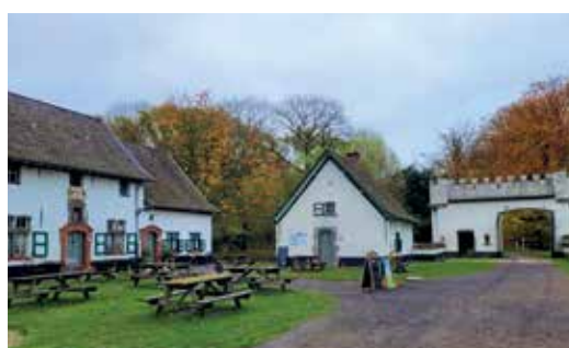
Drongengoedhoeve in het midden van het domein