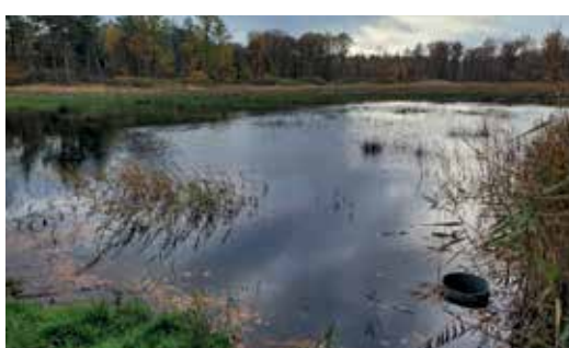
Ruime open plekken waar de heide terug opleeft