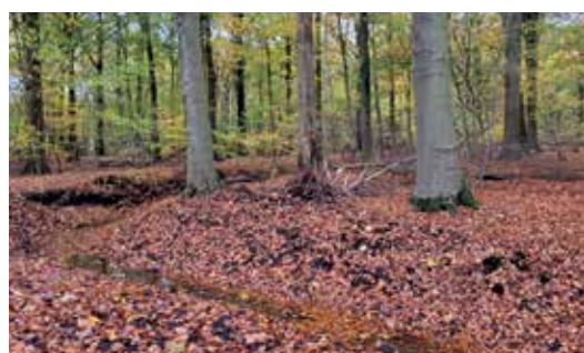
Kleine beekjes kronkelen doorheen het gebied