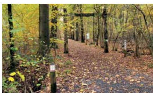
Speelbos à volonté