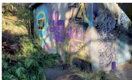
Ondergrondse bunker waar opnames kunnen plaatsvinden