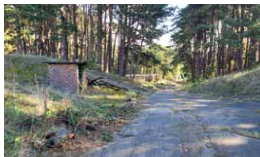
Oude militaire site