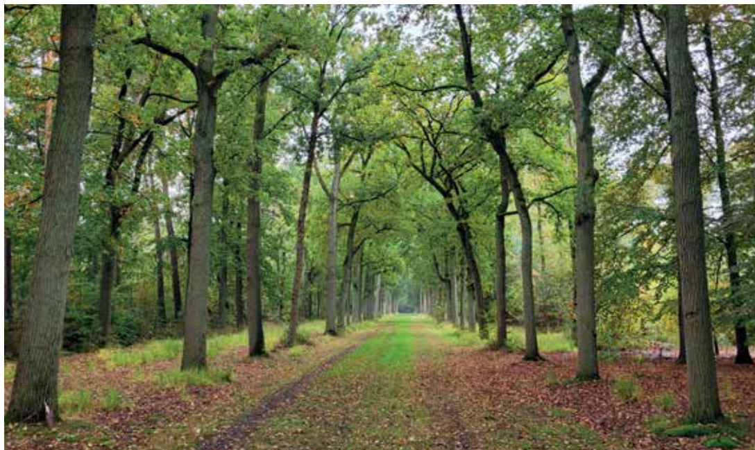
De majestueuze oude oprijlaan