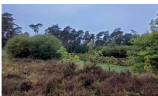
Een ven met heide en andere begroeiing in het midden van het domein