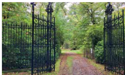
Een romantische toegangspoort