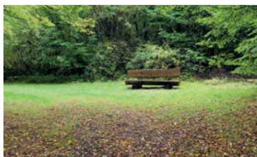
Even rust nodig?