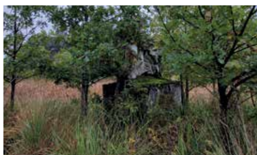
Oude beelden staan verspreid over het terrein