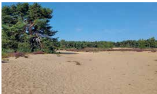
Zandvlakte waar je van het pad af mag