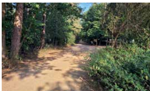
Toegangsweg Kalmthoutse Heide