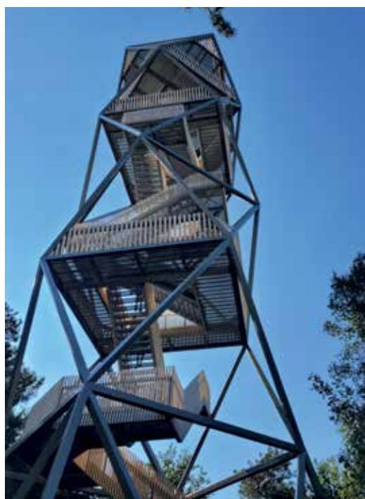
De brandtoren die constant bemand wordt