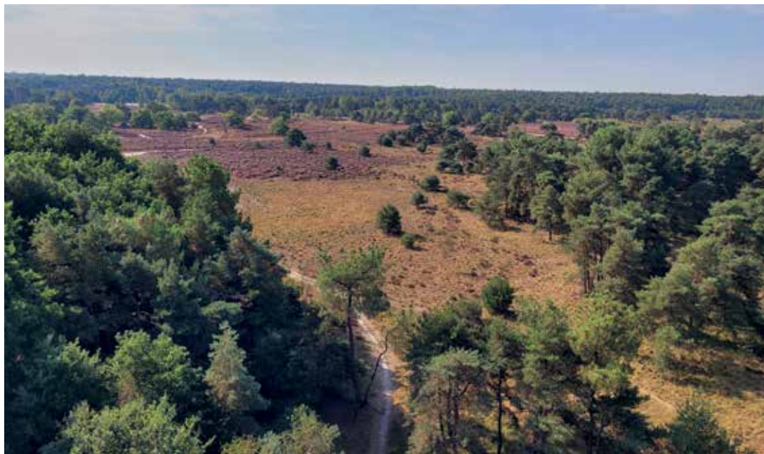
De heide in bloei