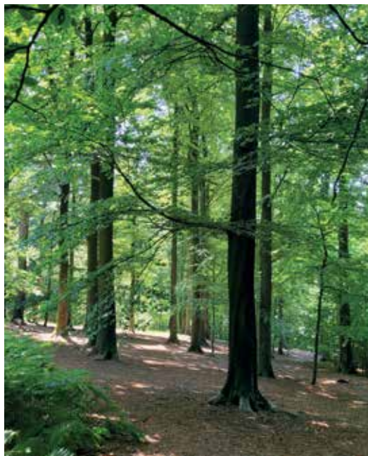
De speelzone met stevige hellingsgraad