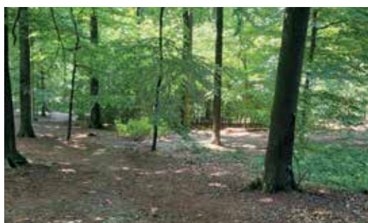
Hier mag je van de paden af