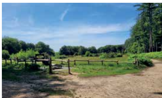
Uitzicht op het heideveld