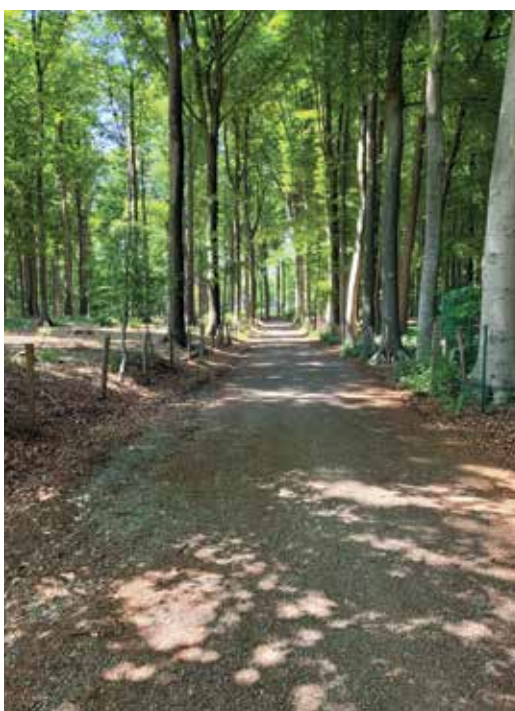
Goed berijdbare paden voor laden en lossen