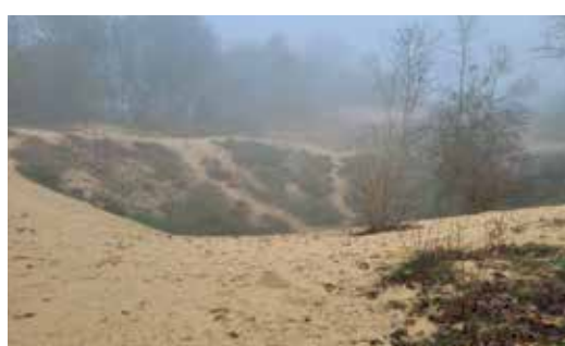
Aan reliëf geen gebrek