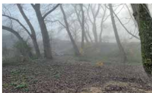
Bomen in de mist