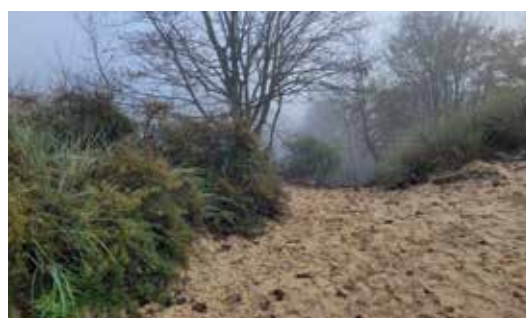
De wilde natuur