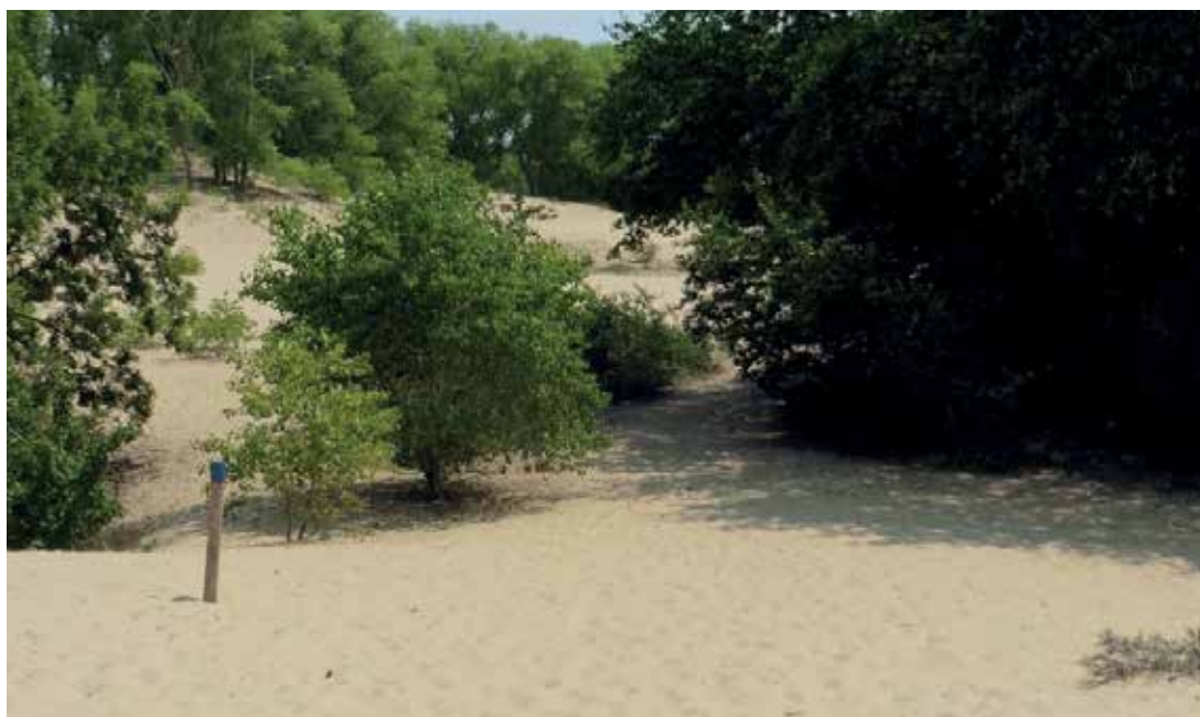
De grote zandvlakte die wordt bewandeld