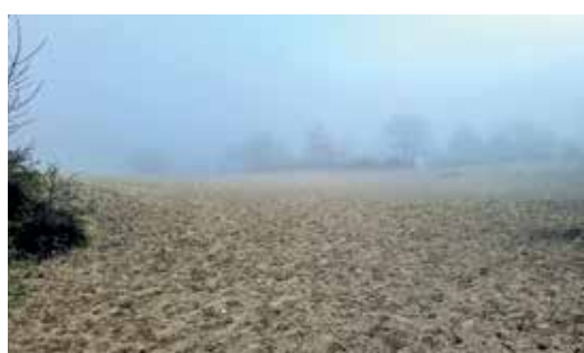
De grote zandvlakte in al z'n glorie