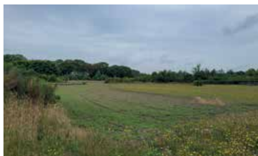
Extra zone voor grote evenementen