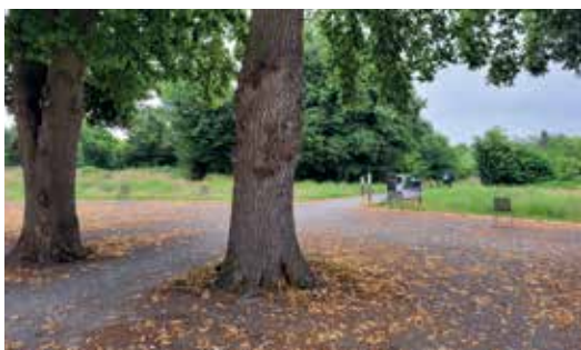
Ingang van het parkbos met ruime parking