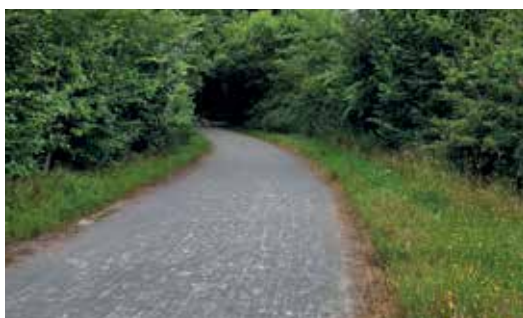
Ruime porfierpaden voor vrachtverkeer