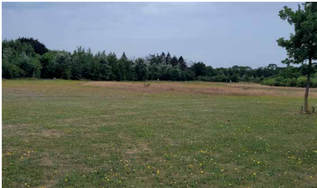
Evenementenweide tot 10000 personen