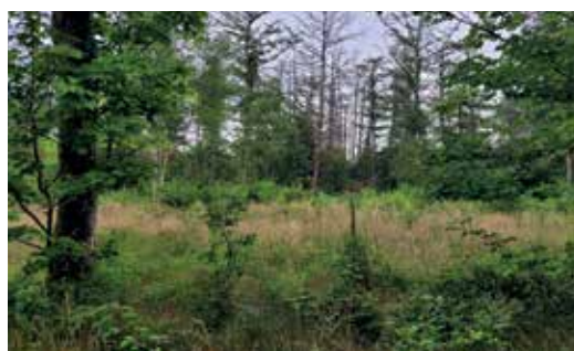
Indianenpaden in het wild