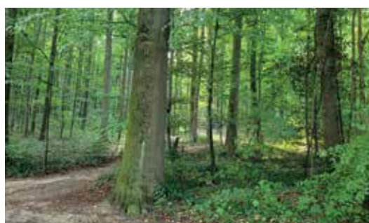
Kleine bospaden in de groene zones