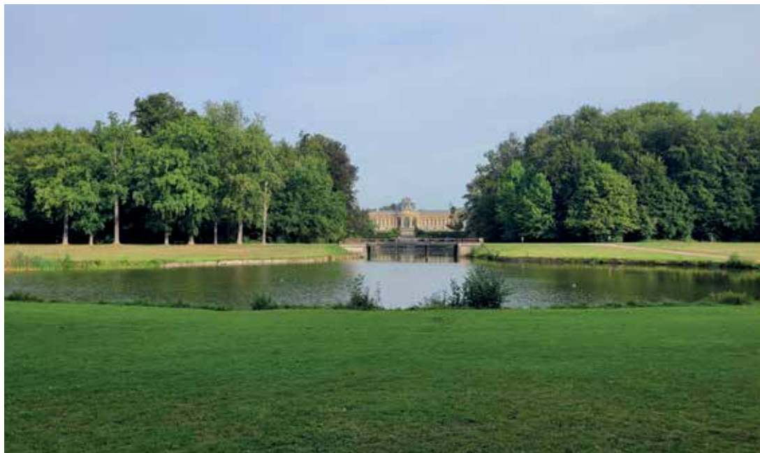
Uitzicht op het Koninklijk Museum voor Midden-Afrika