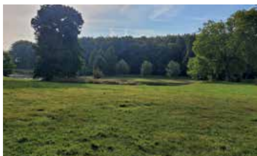
Graszone voor evenementen tot 200 personen