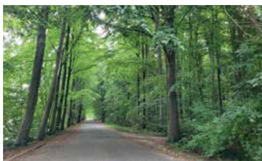
Brede lanen aan de ingang van het park