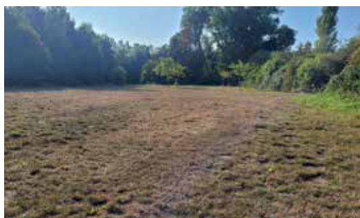
Evenementenzone van 80x50m