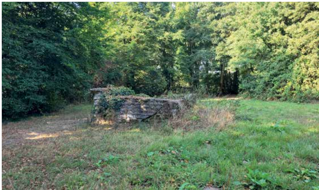
Resten van een oude bunker op het terrein