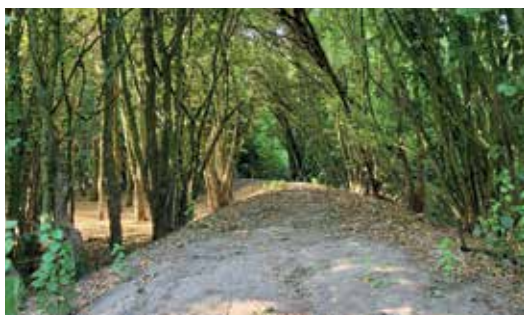
Verskillende speeltoestellen geïnstalleerd doorheen het bos