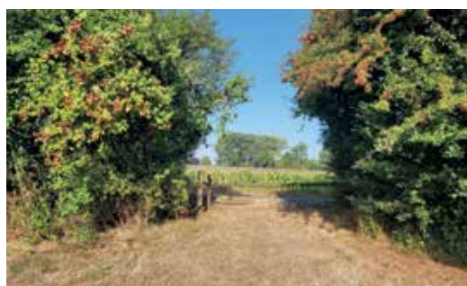
Vlot berijdbare toegang