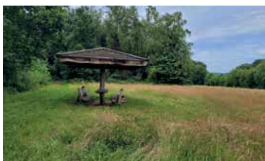
Overdekte eetplaats op evenementenweide