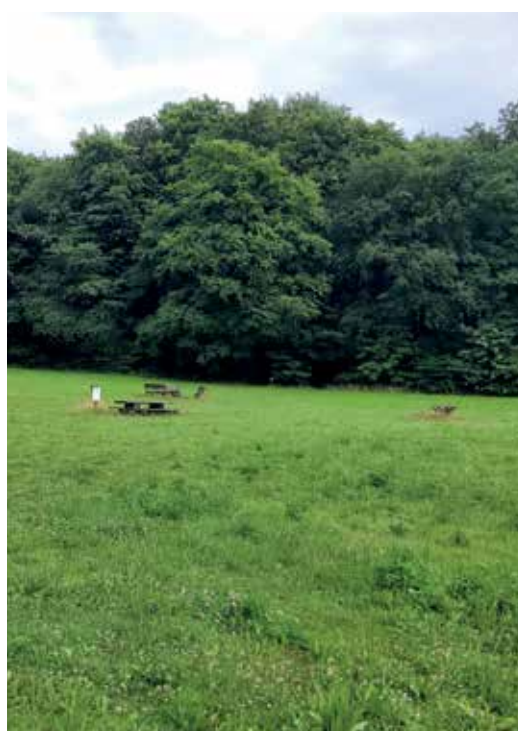
Bivakzone met waterpunt en toilet