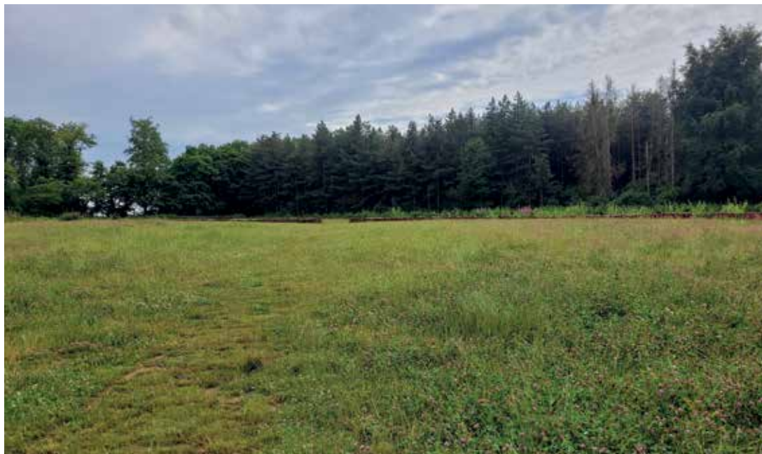
Evenementenweide tot 4000 personen