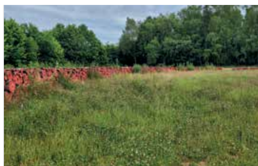
Kunstige omwalling rond evenementenweide