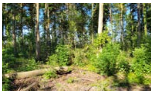
Eerste wilde speelzone