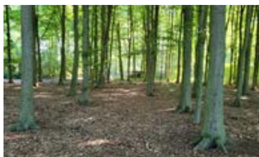
Veel open plekken in het bos