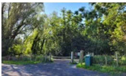
Parking en ingang van het bos