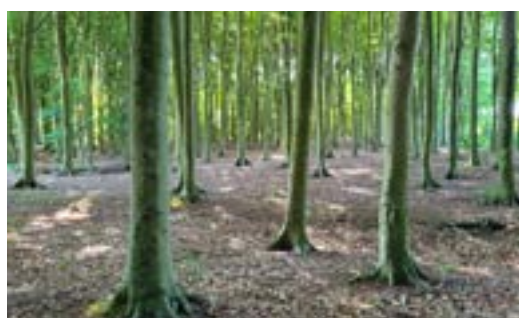
Beukenbos als tweede speelzone