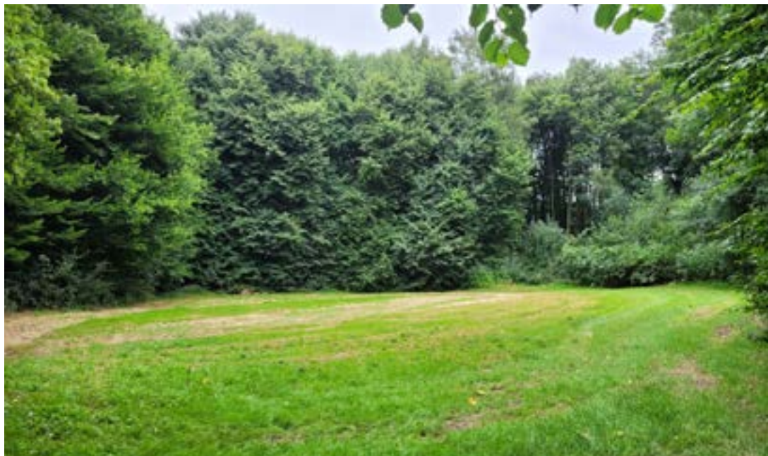
Evenementenzone voor huwelijksfeesten en kleinschalige evenementen (tot 250 personen)