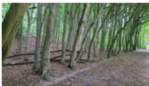
Afwisseling in begroeiing, met wildernis en structuur